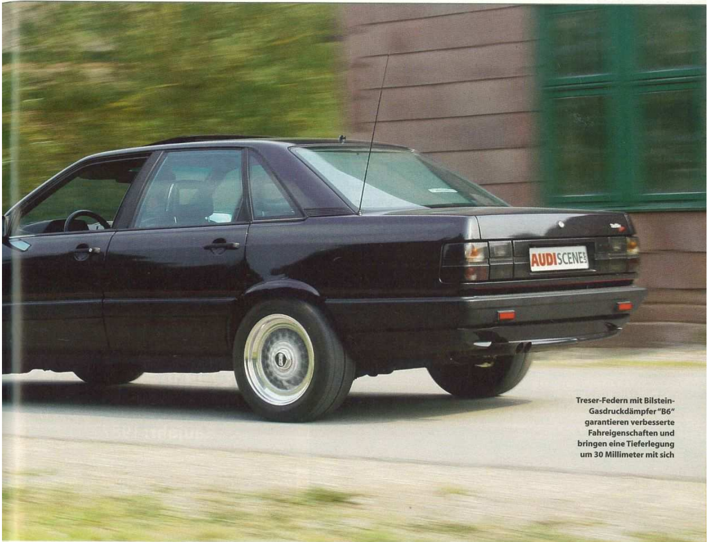
Treser-Federn mit Bilstein-Gasdruckdämpfer "B6" garantieren verbesserte Fahreigenschaften und bringen eine Tieferlegung um 30 Millimeter mit sich

Fall, wieder in den ehemaligen Auslieferungszustand zurück versetzt.