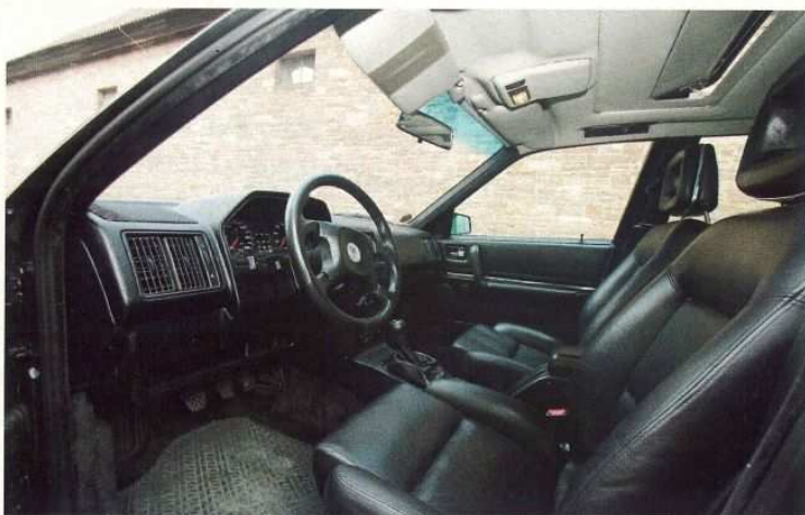
Geringer Handlungsbedarf: Außer dem modelltypisch abgelösten Himmel und der etwas durchgesehenen Leder-Bestuhlung war der Typ 44 beim Kauf gut in Schuss