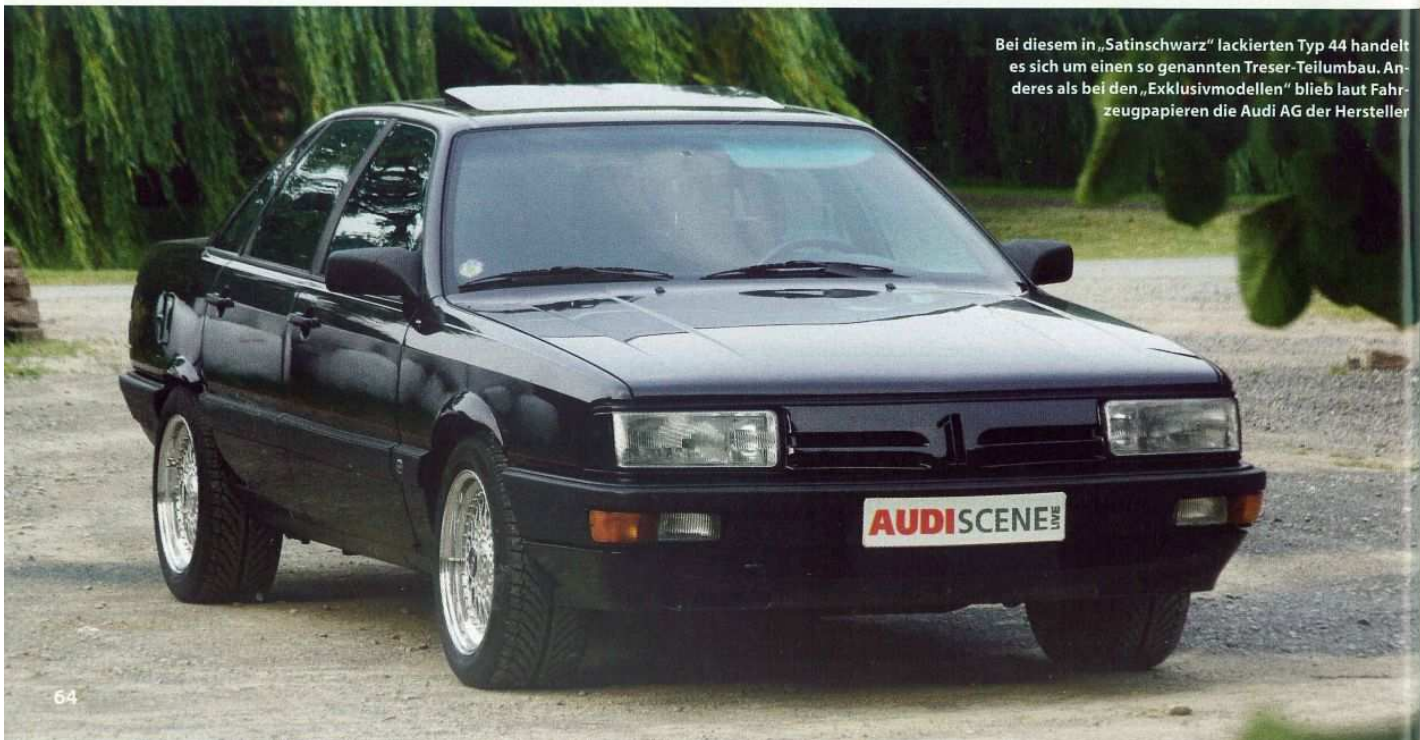
Bei diesem in „Satinsschwarz“ lackierten Typ 44 handelt es sich um einen so genannten Treser-Teilumbau. Anders als bei den „Exklusivmodellen“ blieb laut Fahrzeugpapieren die Audi AG der Hersteller