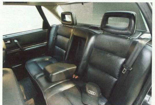
War nicht auf der Bestellliste des Erstbesitzers: Nur eine Klimaanlage fehlt Stefan zum perfekten Audi-Glück

Der vermutlich auf Bestellung des Erstbesitzers als Neuwagen bei Tre-